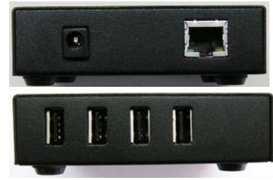
USB2Pro 受信ユニット 両側面