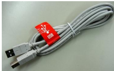
2m USB ケーブル 両端はタイプ A とタイプ B