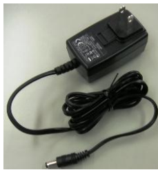
USB2Pro 受信ユニット用 電源アダプタ