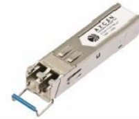
SFP 光モジュール (オプション)