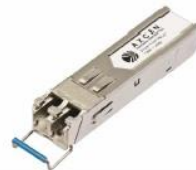
SFP 光モジュール (オプション)