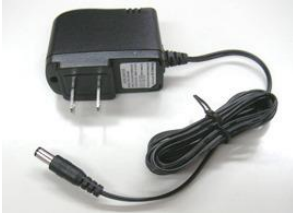
5V 1A 電源アダプタ