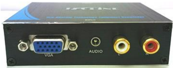
VAH3 アップコンバータ 入力