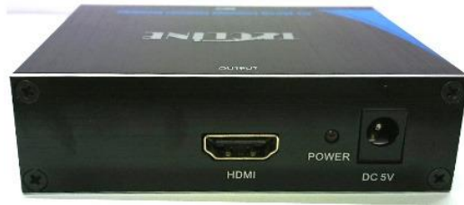
VAH3 アップコンバータ 出力