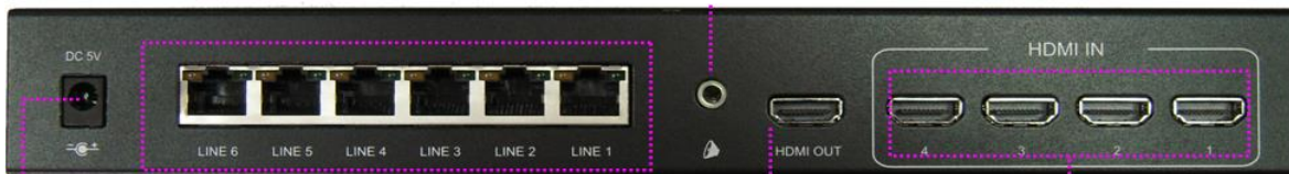
DC5V 2A 電源入力